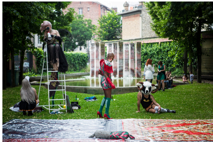
Travball, Mehryl Levisse, 2018

Cette performance, créée par l'artiste et le co-commissaire Florian Gaité, est une production de la maison des Arts de Malakoff. Début du tournoi à 19h30, remise des prix à 22h30. Durée d'un match : 20 minutes. En cas d'intempérie, le tournoi se transformera en rencontre et moment convivial avec les artistes.