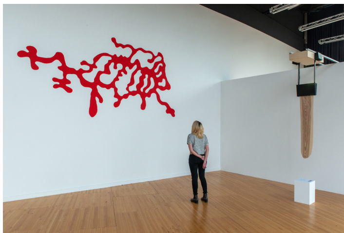
Vue de l'exposition Ré flexions avec les œuvres de Lois Weinberger et de Scenocosme