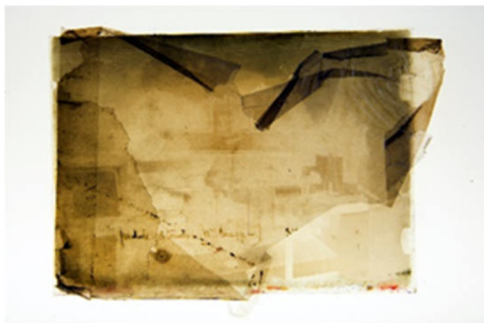
Station de sismologie (vue de l'intérieur), plaque de verre négative, vers 1910, photographie sur table lumineuse, 2019