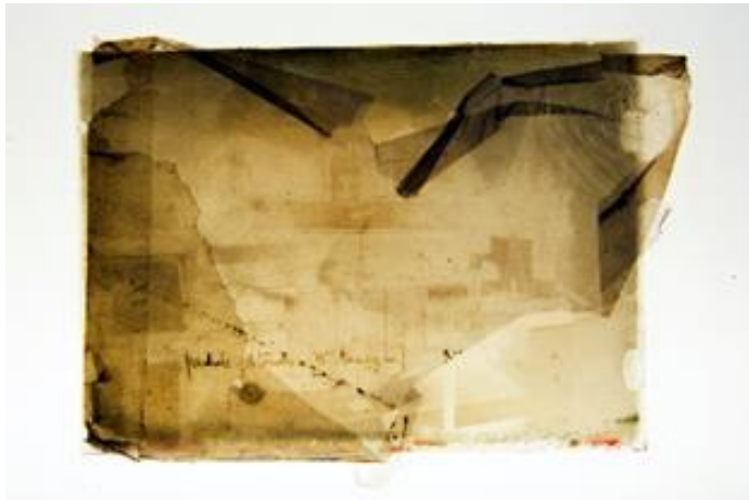
Station de sismologie (vue de l'intérieur), plaque de verre négative, vers 1910, photographie sur table lumineuse, 2019