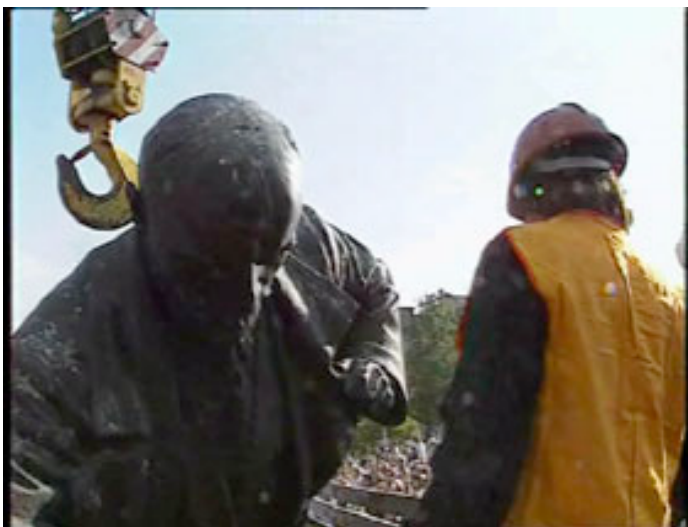
Deimantas Narkevicius, Once in the XX Century , 2004 Collection Frac Alsace, Sélestat

Pour en savoir plus sur cet événement, Frac Alsace : Tél. +33 (0)3 88 58 87 55