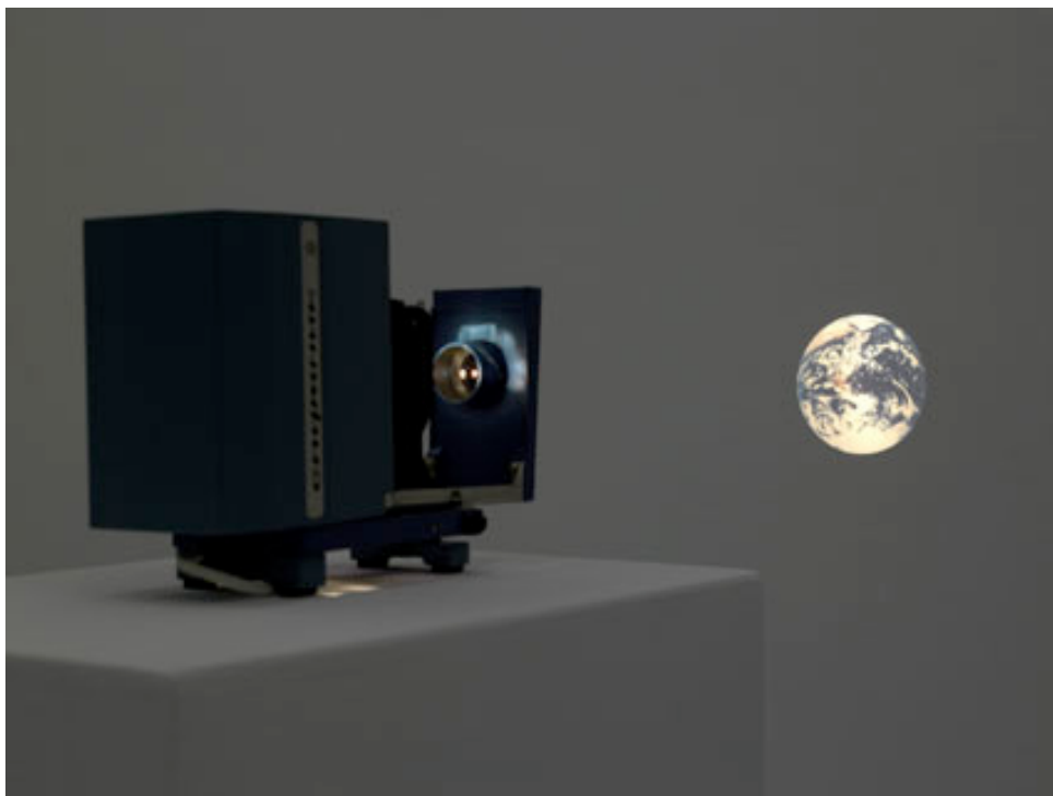
Gintaras Didžiapetris, Sputnik , 2007. Vue de l'exposition au Frac Lorraine, Metz © Gintaras Didžiapetris ; photo Rémi Villaggi

CAC – Centre d'art contemporain, Vilnius, Lituanie 15 Novembre 2008 – 4 Janvier 2009