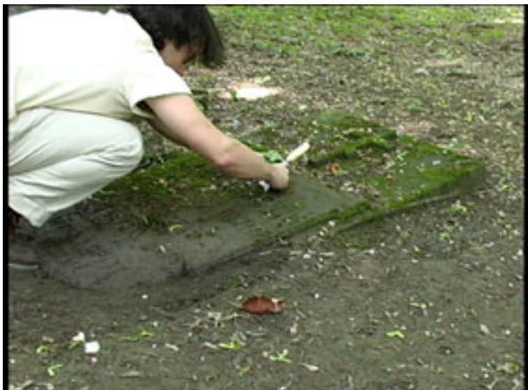
Régis Perray, Relever l'inscription de la tombe de Marek Kalinowski.

plein tarif : 8 LTL - tarif réduit : 4 LTL - tarif réduit pour tous le mercredi Tél. +370 5 2121945 - info@cac.lt - www.cac.lt