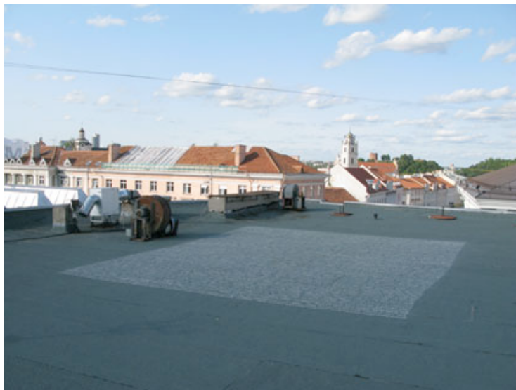
Jean-Christophe Norman, Rectangle 650 x 750 cm , 2008 Intervention durant la résidence à Vilnius (craie sur le sol) © J.-C. Norman