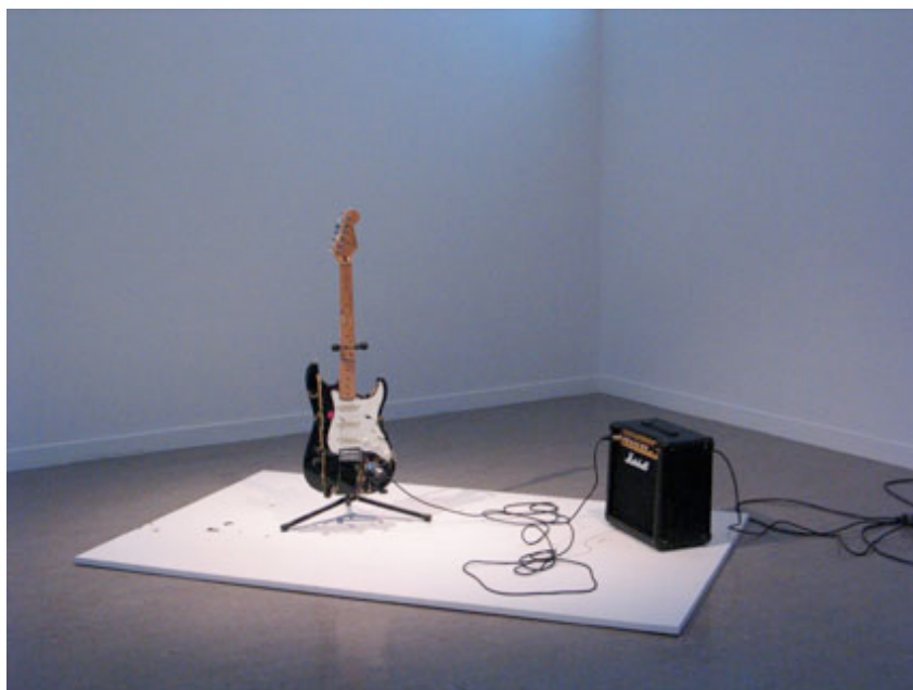
Émilie Pitoiset, Hard to Explain , 2006

palaisdutau@monuments-nationaux.fr / tél. +33 (0)3 26 47 81 79 www.palais-du-tau.fr