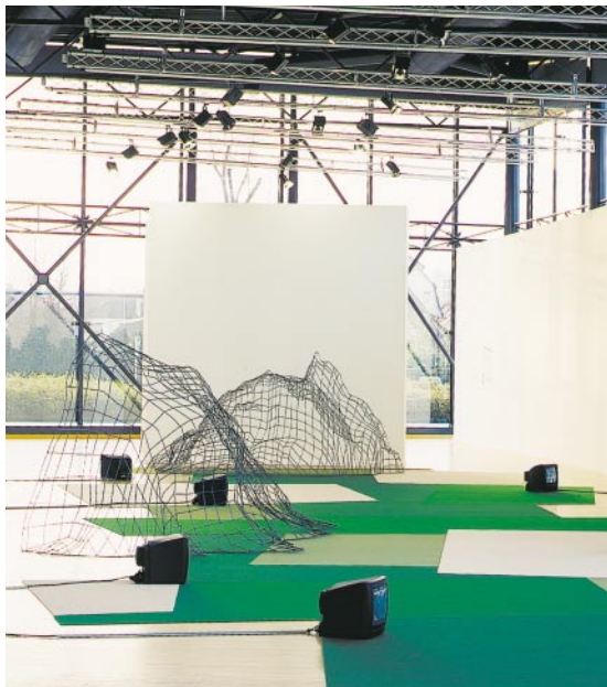
Bernard Calet, « Proximité », 2003