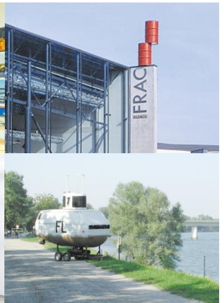
Étienne Bossut, « Un peu d'incertitude », 2003