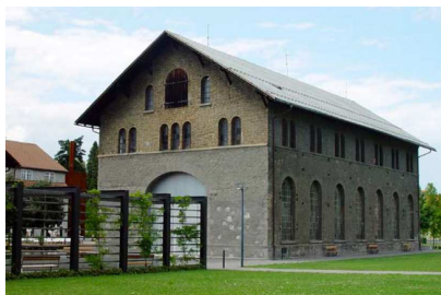
Montagehalle Außenansicht.jpeg