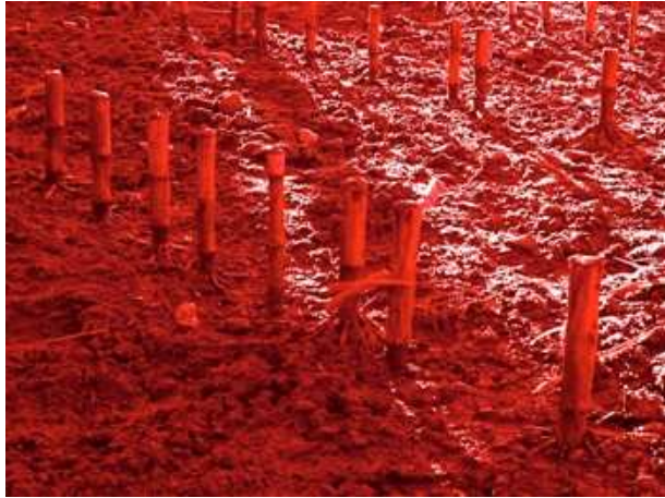
Didier Marcel, „Red Harvest“, 2011 Kunstharzabdruck