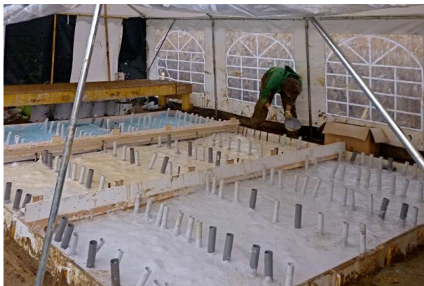
Didier Marcel, „Red Harvest“, 2011 Vorbereitung des Abdruckes